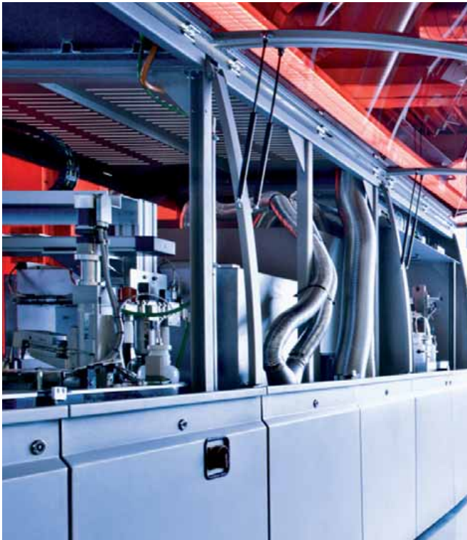
Produktionsdienstleister Stoppani zeigt eine Neuheit: Brillengiesanlage von Interglass Technologie (CH)