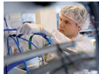
Stoppani-Reinraumspezialisten bei Vorbereitungsarbeiten im Reinraum der Klasse 10'000.