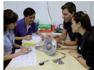
Schweizer Qualitäts-Alltag in Penang, Malaysia...

Zur Sicherung gleich hoher Qualität gehören auch die gleichen Werkzeuge, Messwerkzeuge, Kleinmaschinen und Einrichtungen. Brütsch/Rüegger Tools darf dank seiner versierten Exportabteilung (siehe Titelartikel) und der weltweiten Bestellmöglichkeit über den ToolShop www.bw.ch regelmässig an die Stoppani Systems nach Penang liefern!