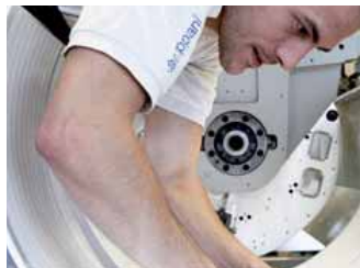
Ob Prototyp oder Serie: Die Stoppani-Fertigungsspezialisten schaffen das Herz neuer Produkte...