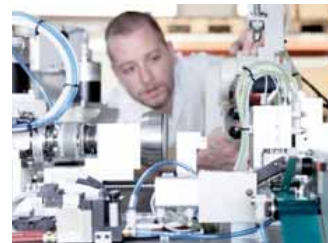
...und die Stoppani-Montagefachleute bringen die Produkte in ihre beste Form.